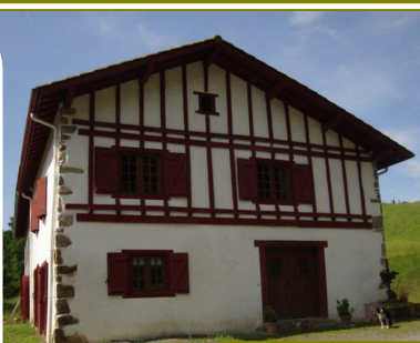
La Ferme Bixarteia

Fromages de brebis, de vache et de chèvre, conserves de canard et de porc basque, jus de pomme, cidre, vin, miel, confitures, plantes